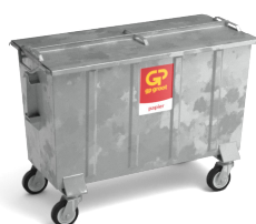
Papier/karton container 770, 1100, 1700 en 2400 liter