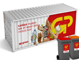
Evenementen container 20ft