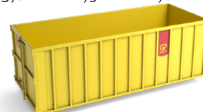
30 m 3 open container L 6,0m x B 2,5m x H 2,0m