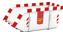
10m 3 open container L 3,6m x B 1,9m x H 1,6m