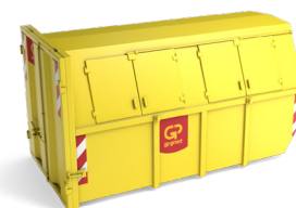
10m 3 gesloten container L 3,6m x B 1,9m x H 2,0m