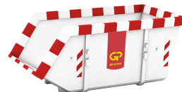
10m 3 open container L 3,6m x B 1,9m x H 1,6m