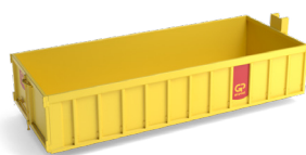
15 m 3 open container L 6,0m x B 2,5m x H 1,45m