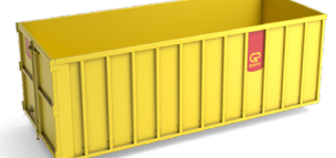
30 m 3 open container L 6,0m x B 2,5m x H 2,0m