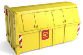
10m 3 gesloten container L 3,6m x B 1,9m x H 2,0m