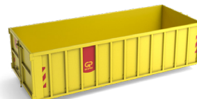
20 m 3 open container L 6,0m x B 2,5m x H 1,7m