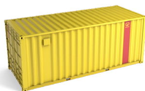
Evenementen container 20ft