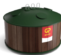
(Semi-)ondergrondse container 5m3