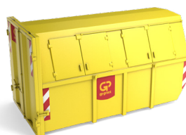
10m 3 of 16m 3 gesloten container